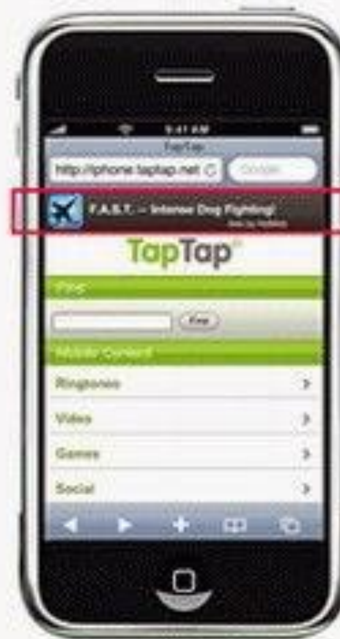
Web Display Ads